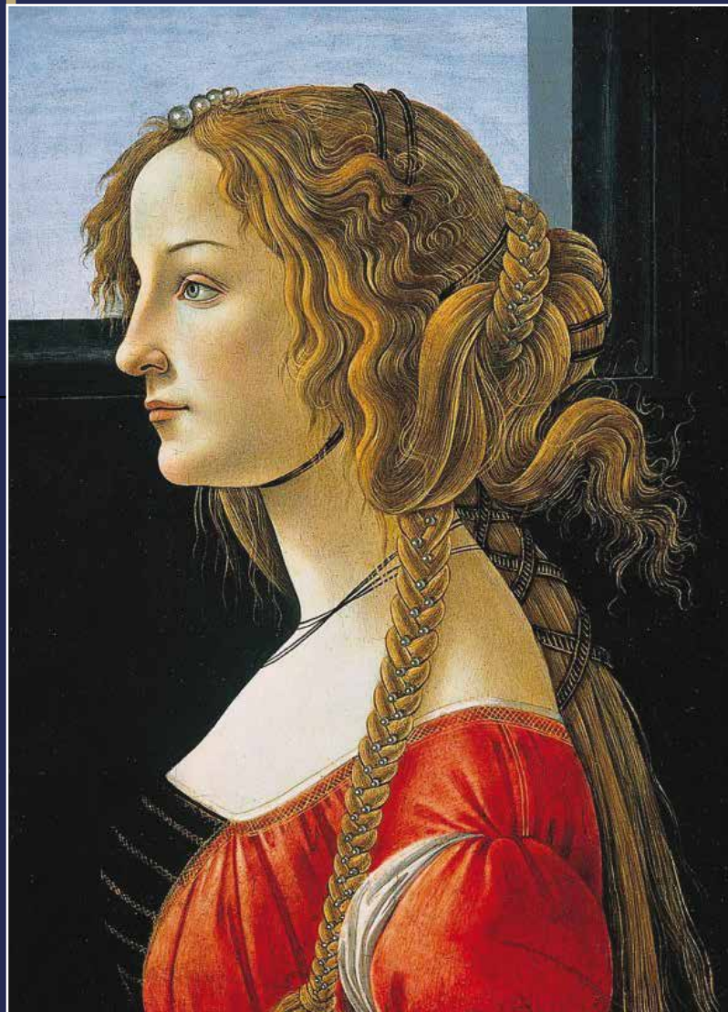
Portrait de Simonetta Vespucci par Sandro Botticelli, 1480, Musée d'État, Berlin

13 - 14 SEPTEMBRE 2019 PALAIS DES CONGRÈS